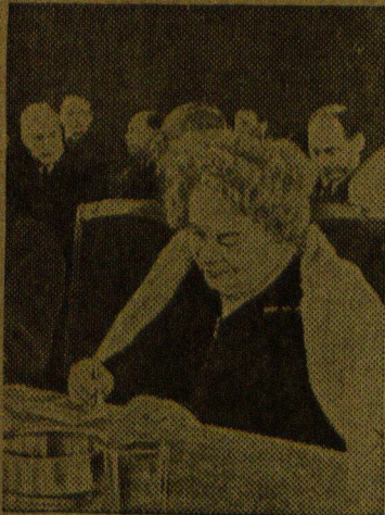
НЕДАВНО в Москве состоялся второй пленум правления Союза советских композиторов СССР. Пленум подвел первые итоги творческой работы композиторов после постановления ЦК ВКП(б) от 10 февраля 1948 г. На снимке: старейший музыкальный деятель страны — Е. Гнесина.